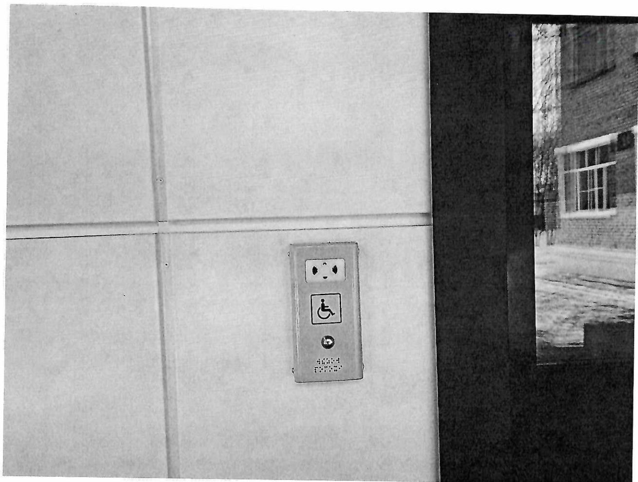
Фото №2. Кнопка вызова персонала рядом с входной дверью