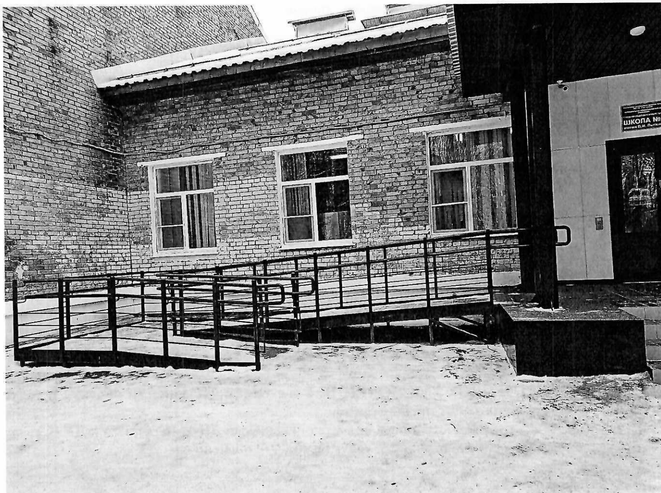
Фото №1. Пандус на входной группе

Приложение к Акту выполненных работ по адаптации объекта и повышению уровня доступности образования для людей с инвалидностью и маломобильным группам населения (МГН) в период с 2018 по 2022 годы к паспорту доступности ОСИ № 79 от 31.07.2018 года